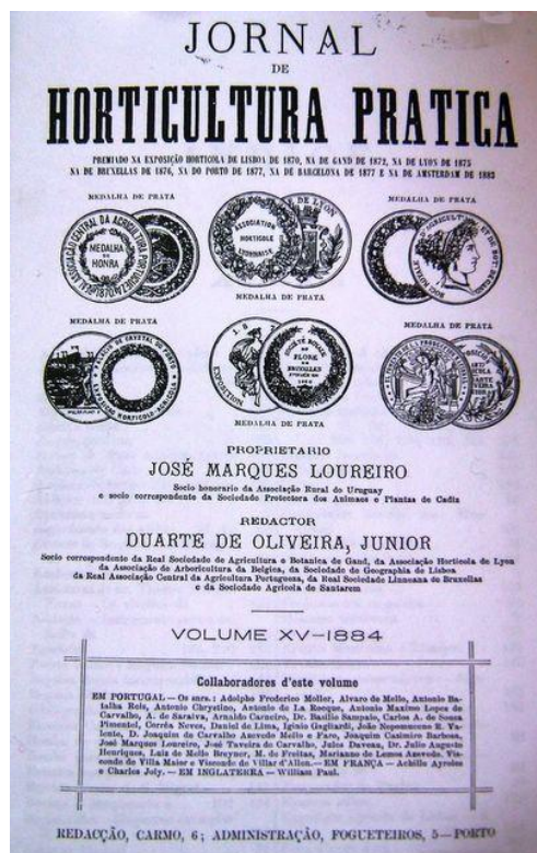
Jornal de Horticultura Prática, Porto, Portugal,