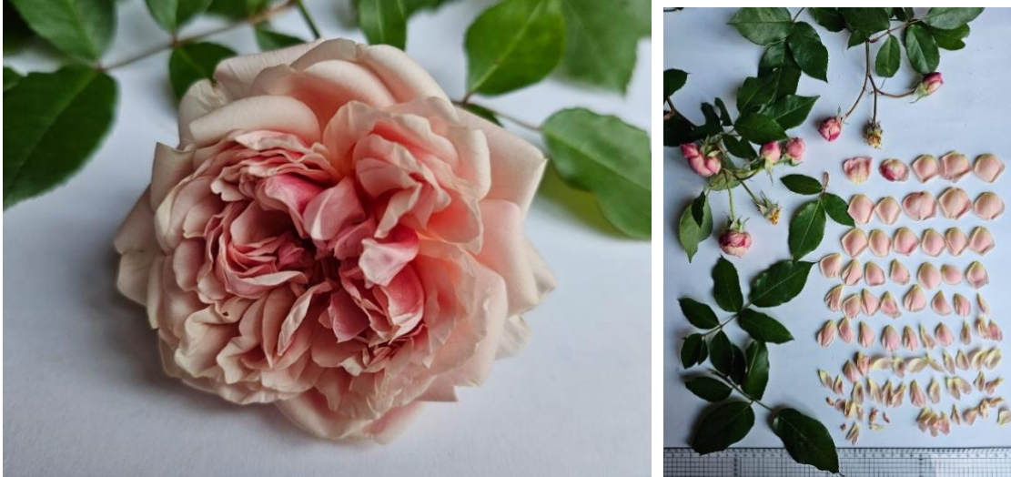
Análisis botánico de la rosa 'Duarte de Oliveira'

Se trata de una planta trepadora muy vigorosa, de ramas arqueadas que alcanza de 1,50 a 2 m de altura.